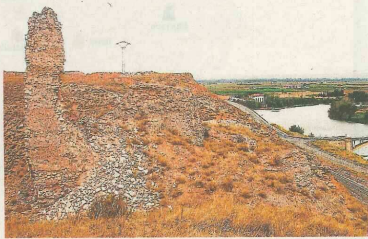
JOSÉ LUIS ONA

La joya poco conocida. Con cuatro mil metros cuadrados de superficie y varios recintos escalonados, el de Peracense es uno de los más espectaculares de España. Todavía no es suficientemente conocido.